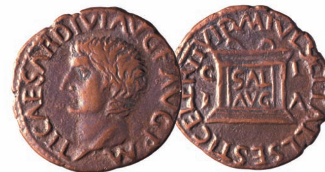
Semis de cobre de la ciudad romana de Ilici (La Alcudia, Elche)