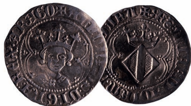
Dihuité de plata de Alfonso el Magnánimo

Para todo ello, se muestran monedas de la colección numismática custodiada por el MARQ, procedentes de yacimientos de diversa cronología de la provincia de Alicante, de hallazgos casuales o monedas integradas en colecciones particulares constituidas en buena parte por monedas aparecidas en nuestra provincia.