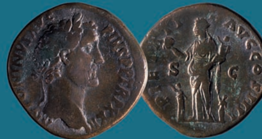
Sestercio de bronce del emperador Antonino Pío