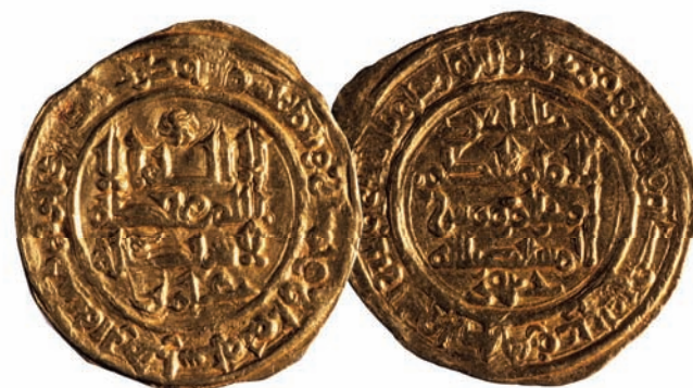
Dinar de oro de al-Hakam II