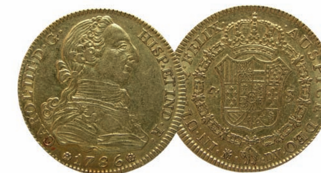
Cuatro escudos de oro de Carlos III