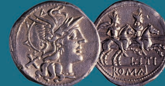
Denario de plata de la República romana

El discurso expositivo de esta muestra tiene ante todo una vocación didáctica y explica los diversos puntos de vista desde los que podemos aproximarnos a la contemplación de las monedas.