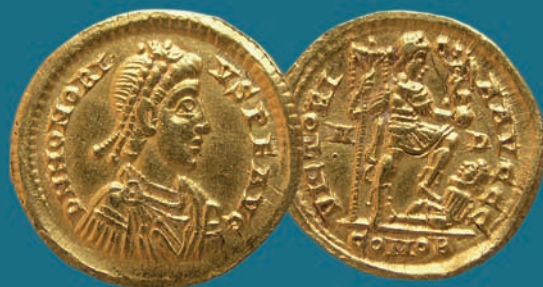
Sólido de oro del emperador Honorio