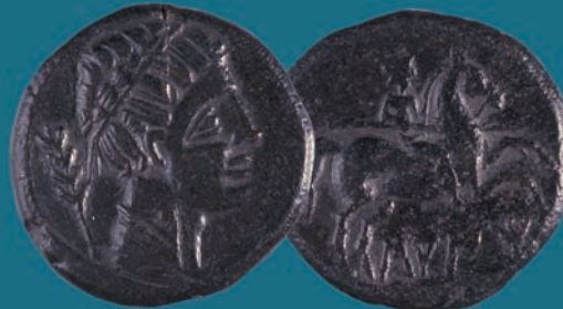
Moneda de bronce de la ciudad ibérica de Saitabi (Xàtiva, Valencia)